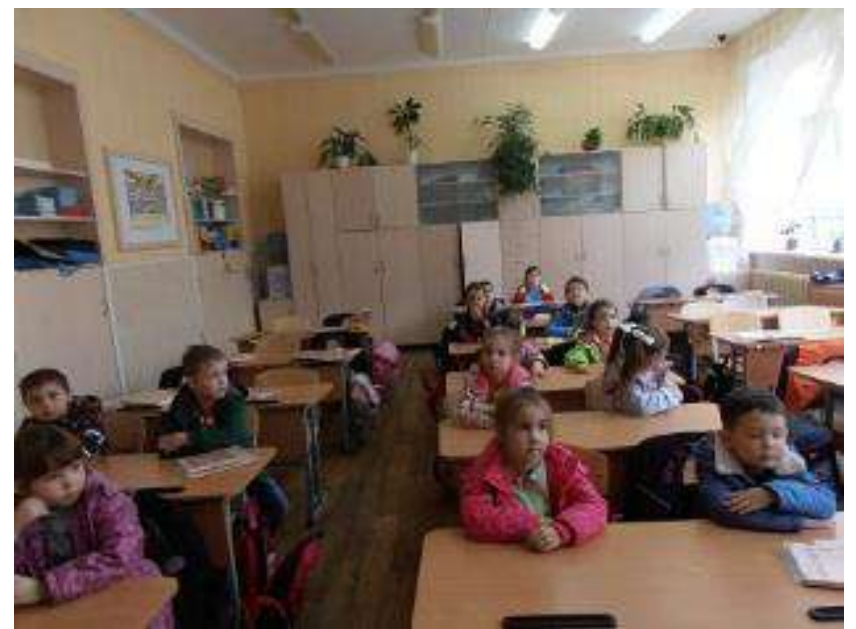
Знакомство с профессией учителя и библиотекаря в СОШ № 10