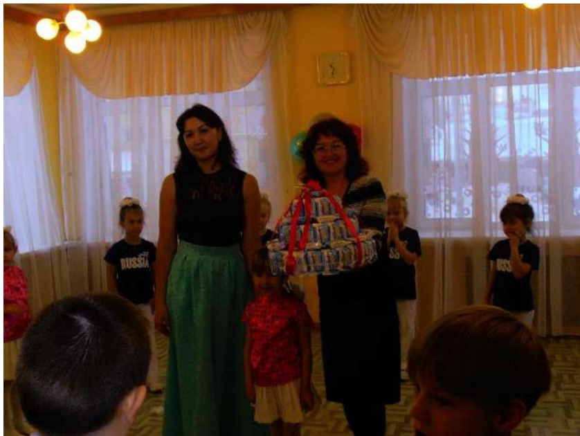
Благотворительный концерт к Дню инвалидов и юбилею учреждения в д/с № 23