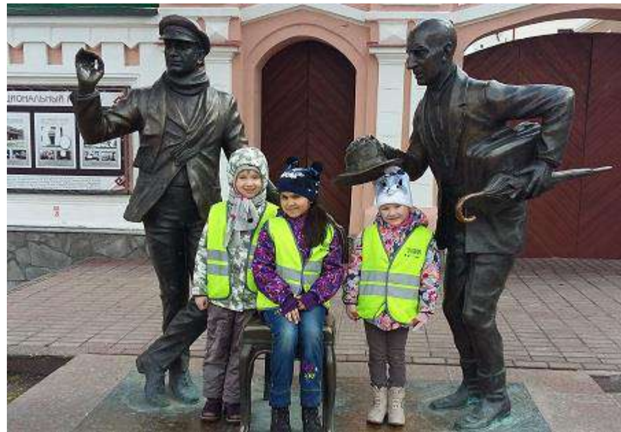
День исторических мест и памятников на Арбате и Заливе