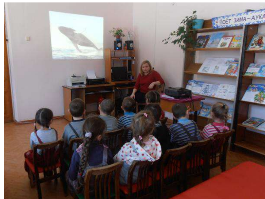
Совместные мероприятия в библиотеке им. А. Пушкина