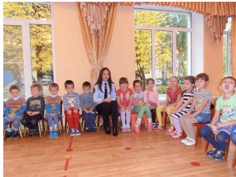
Совместные акции «Полиция и дети», «Безопасность на водных объектах», «Безопасная дорога»