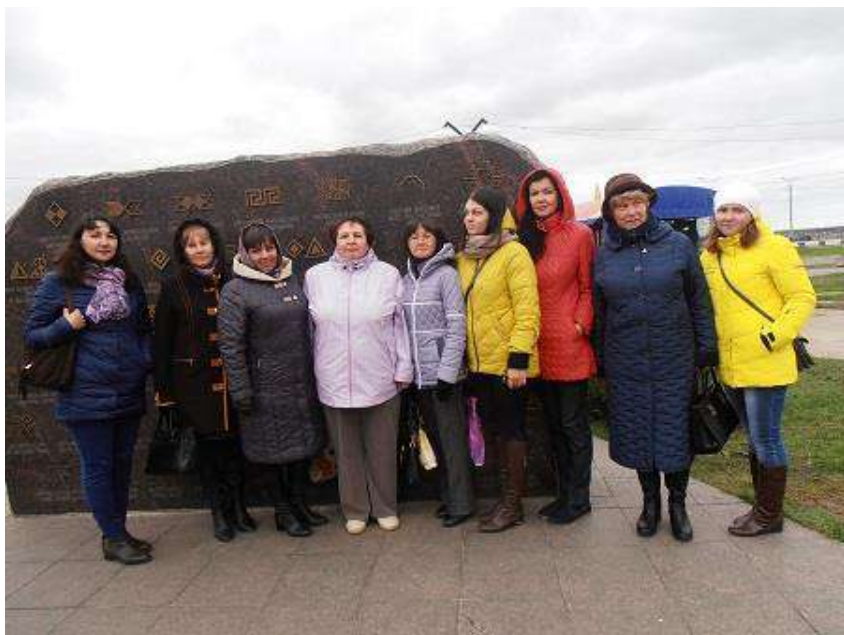
Образовательный туризм для педагогов