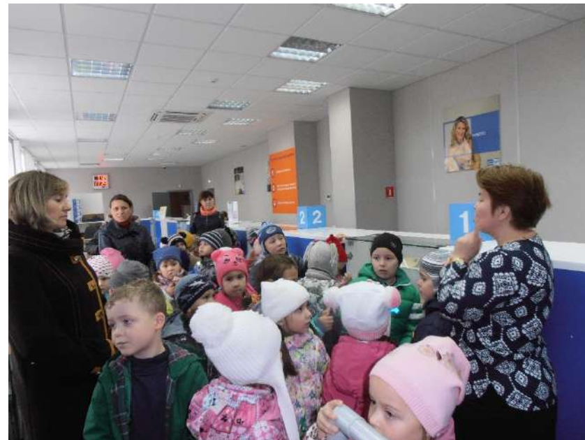
Экскурсия на Главпочтамт