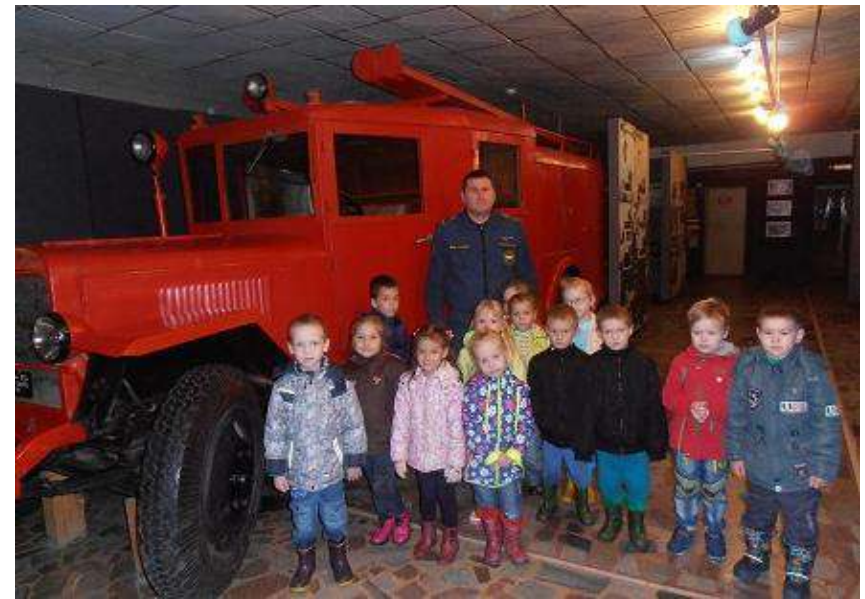
Посещение музея пожарной охраны и Пожарной части № 4